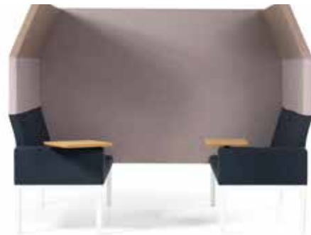
Reform, höchste rück höhe, trenn Wand 212cm, Armlehnen mit Tischplatte