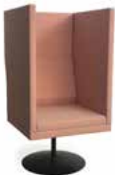
Reform 1-sitz, Stay Gestell