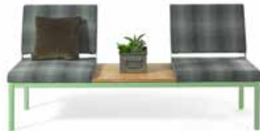
Reform, niedrige Rücken, offenem Rücken, Eiche Tisch