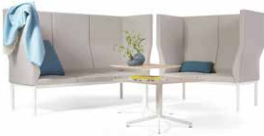
Reform middle höhe Rücken, long corner back