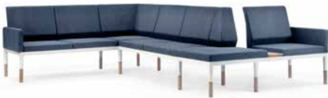
Reform niedrige Rücken

Reform Lounge ist eine moderne Sofagruppe bestehend aus Sessel und 2- und 3-Sitzer Sofa. Die weichen Kissen sollen Sie zu entspannenden Momenten einladen.